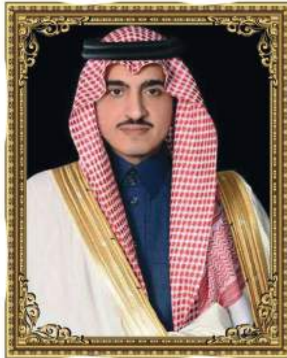
صاحب السمو الملكي الأمير بدر بن سلطان آل سعود نائب أمير منطقة مكة المكرمة حفظه الله