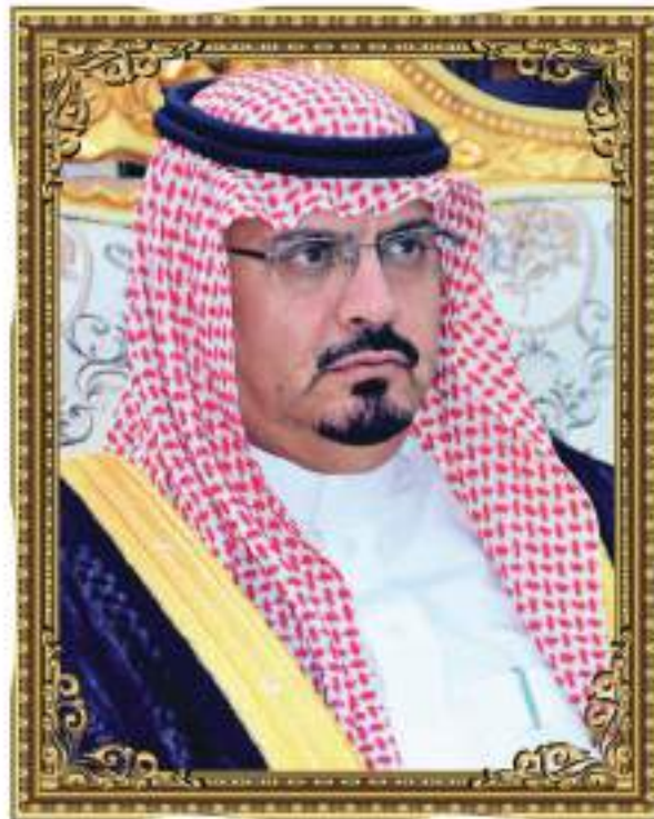
سعادة الأستاذ ناصر بن حمود السبيعي وكيل محافظ الطائف