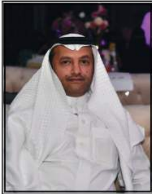
سعادة الاستاذ دسمان بن حمدان الفقيه امين عام غرفة الطائف

نقدم لكم تصوراً شاملاً عن ما قامت به غرفة الطائف من إنجازات ووضعها المالي للعام ٢٠٢١م مع اقتناعنا التام بأن هناك أمور لم يتم التطرق إليها. وذلك ضمن المسؤوليات التي تضطلع بها غرفتكم الموقرة في رعاية مصالح القطاع الخاص وتطويره وتلمس متساكله وتبني آرائه ومقترحاته. نرجوا من الله العلي القدير ان تجدوا في محتويات هذا التقرير ما يعكس حجم العطاء والجهود المبذولة رغم التحديات التي واجهت القطاع الخاص، كما يسعدنا تلقي مرثياتكم ومقترحاتكم البناءة والتي ستكون محل اهتمامنا جميعاً، سائلين المولى عز وجل ان يوفقنا لما فيه الخير والسداد.