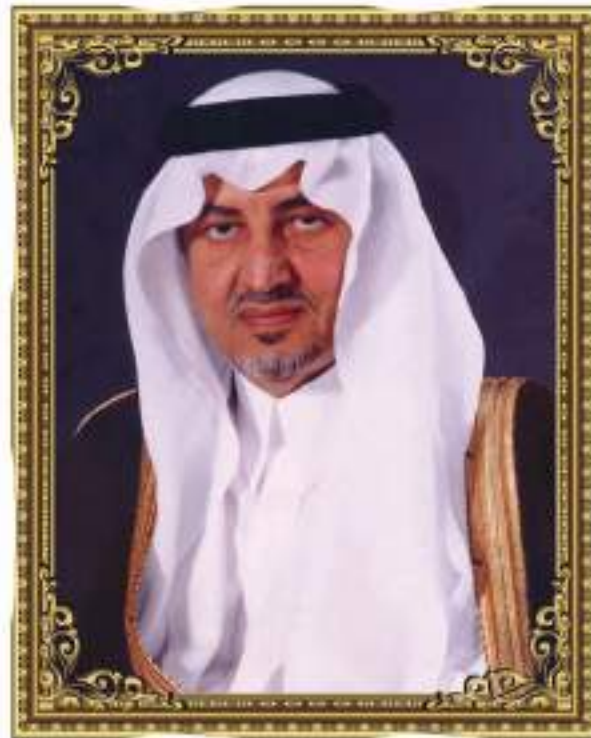
صاحب السمو الملكي الأمير خالد الفيصل آل سعود مستشار خادم الحرمين الشريفين أمير منطقة مكة المكرمة حفظه الله