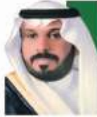
سعادة الأستاذ غازي بن مسعود القنامي النائب الثاني لرئيس مجلس الإدارة