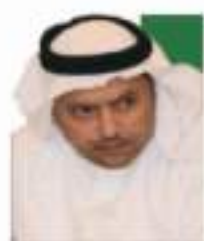
سعادة الأستاذ دسمان بن حصان الضقيه الأمين العام