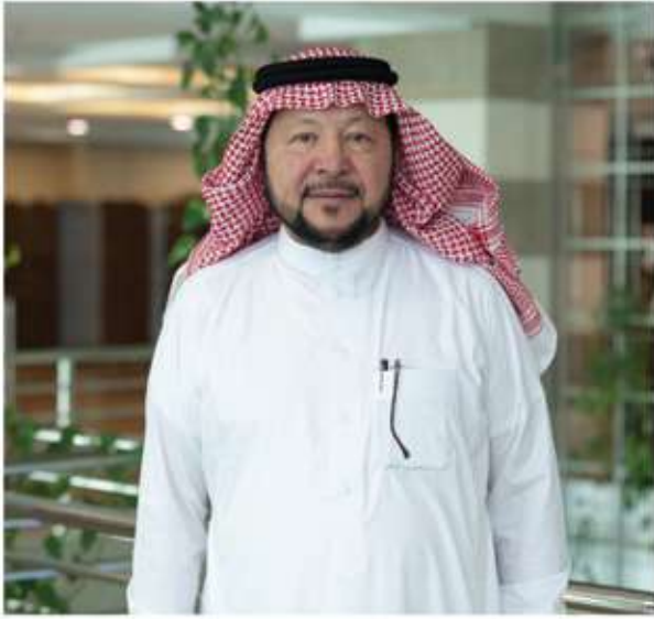
بأي وسيلة كانت.

كثير من الوظائف والنشاطات التجارية ستنتهي مع هذا لتقدم الرقمي والتقني السريع .. كيف تنصح شباب وشابات الأعمال؟