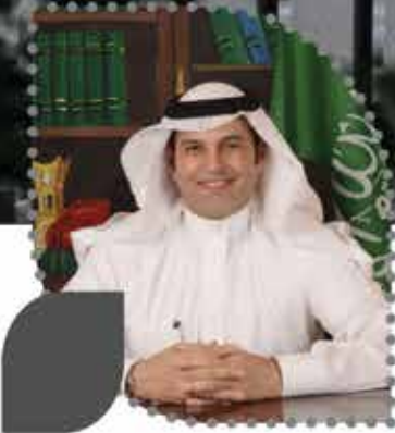
الدكتور محمد بن دليم القحطاني أكاديمي وخبير اقتصادي @DRMDMQ